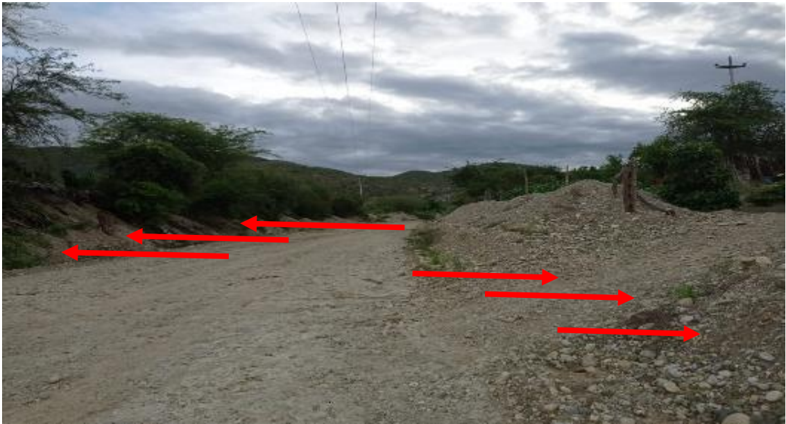
FOTOGRAFIA N°02: SOCAVACIÓN EN AMBAS MARGENES DE LA QUEBRADA PORTACHUELO EN LA TEMPORADA DE MAXIMAS AVENIDAS.