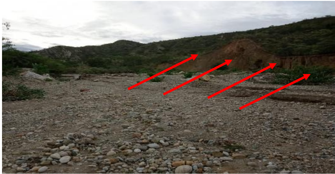
FOTOGRAFIA N°01: TRAMO CRÍTICO EN LA QUEBRADA PORTACHUELO, DISTRITO DE CHOROS, PROVINCIA DE CUTERVO, DPTO CAJAMARCA.